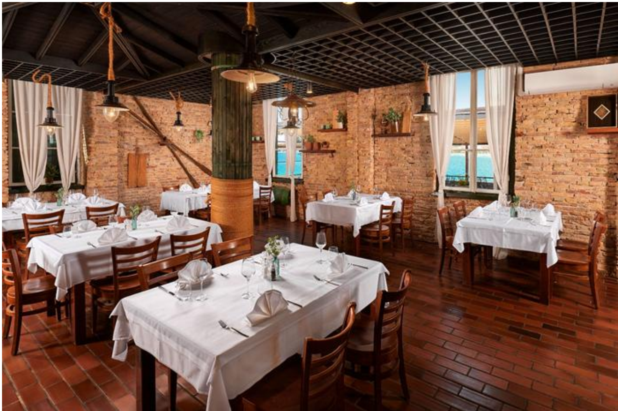
Slika br. 6 – Restoran (konoba) Lanterna

20:00 – 22:30 Radna večera u konobi Lanterna; večera uz međusobno predstavljanje, razmjenu iskustava i međusobno upoznavanje sudionika, program žive dalmatinske glazbe prikladne konobama; svi sudionici pozvani su sudjelovati u izvedbi (pjevušiti)