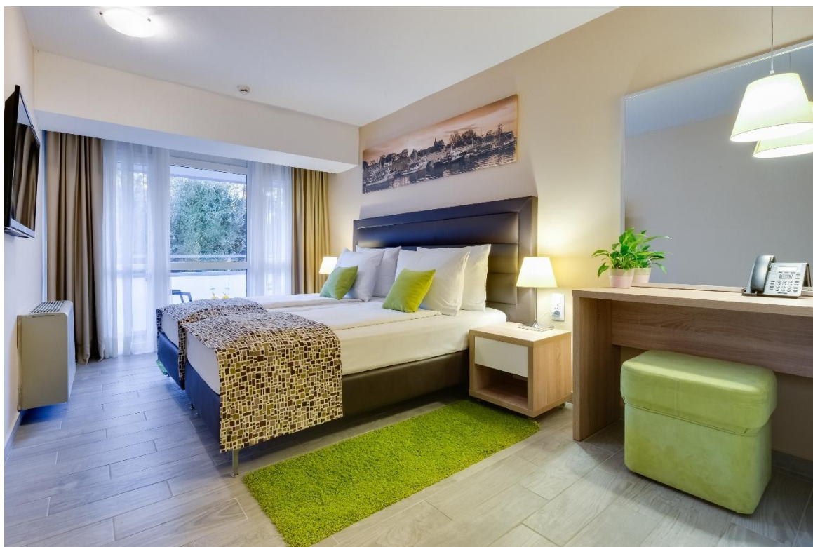
Slika br. 5 – Hotel Pinija – soba s balkonom

18:00 – 18:40 Predstavljanje programa Bono koji uključuje set kratkih tjelovježbi za revitalizaciju organizma i zdravlje mišićno skeletnog sustava poglavito namijenjenog osobama koji obavljaju poslove koji uključuju dugo sjedenja uz računala, program uključuje i jednostavne psihološke tehnike za otklanjanje negativnih učinaka dnevnog stresa;