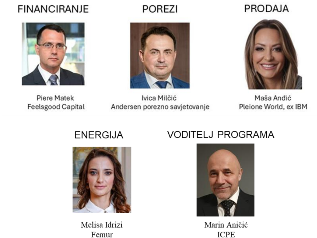
Slika br. 1 – Predavači, savjetnici programa RESET

RESET je edukacijsko savjetodavni program u predivnim ambijentima hotela Pinija u Petračanima, koji se nalazi na poluotoku s tri strane okružen morem. Program predstavlja kombinaciju edukacije, savjetovanja, networking-a i relaksacije na izrazito ugodan i ležeran način. Polaznike podučavaju vodeći hrvatski stručnjaci za područja financiranja, poreza, prodaje. Uz navedeno, polaznici usvajaju BONO – set vježbi za otklanjanje negativnih posljedica sjedenja i stresa uz individualno savjetovanje od strane fizioterapeuta.