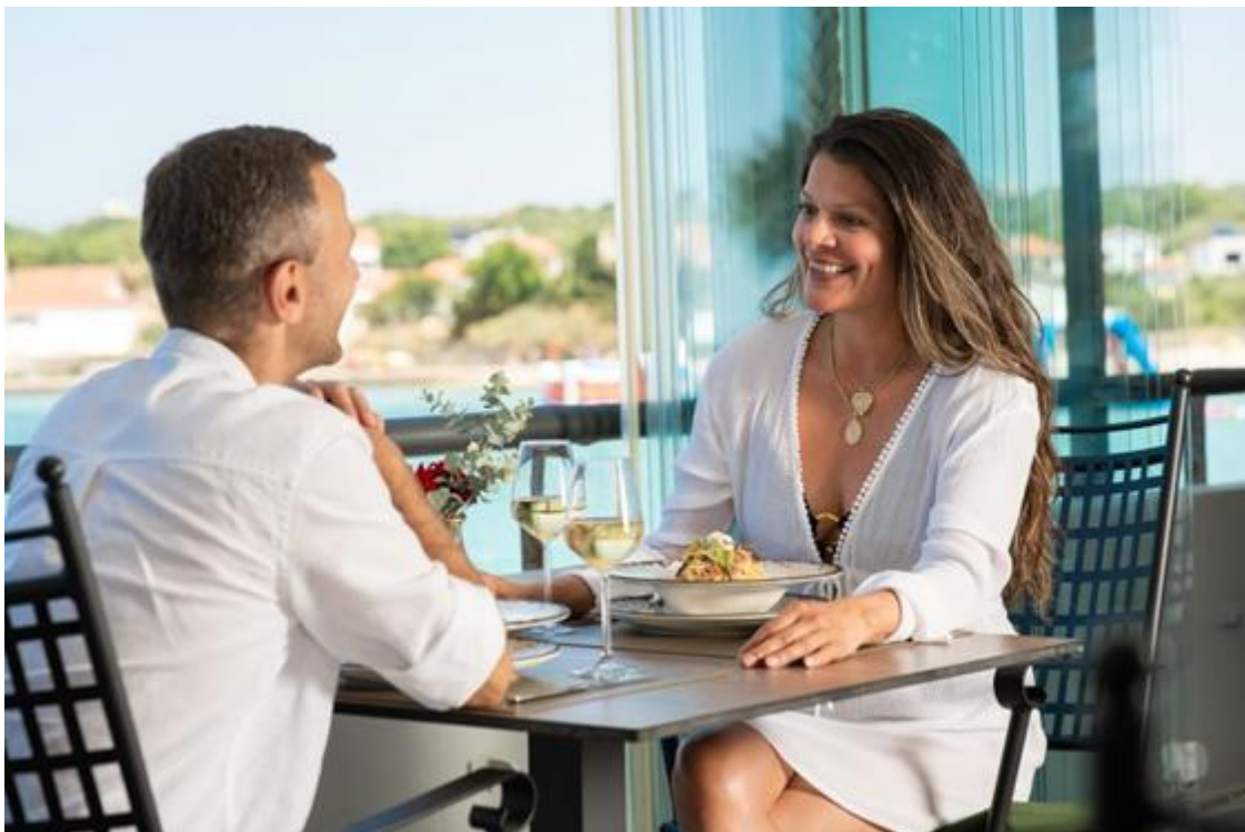
Slika br. 3 – Hotel Pinija Restoran Lanterna